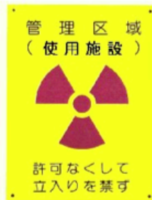
写真②管理区域 (使用施設)標識